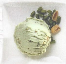
Pistache Rahmglace mit gerösteten Pistazienstückchen