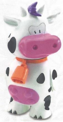
Belinda Vanilleglace CHF 6.00