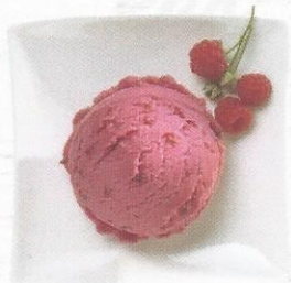
Himbeersorbet Sorbet mit Himbeerstückchen