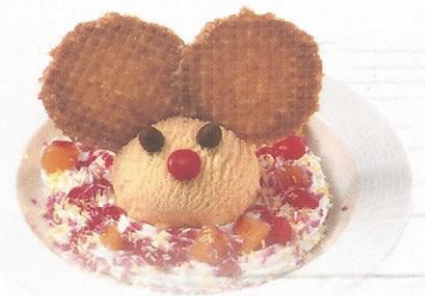
Mickey Mickey mit feinem Vanille Glace CHF 6.00