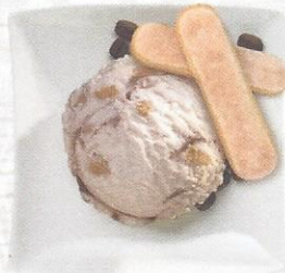
Tiramisù Glace mit Kaffeesauce und Gebäckstückchen