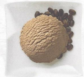
Ice Café Rahmglace