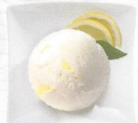
Zitronensorbet Sorbet mit Zitronen-Zesten