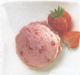
Erdbeer Rahmglace mit Erdbeerstückchen