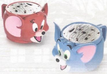
Tom & Jerry Stracciatellaglace CHF 6.00