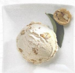
Walnuss Rahmglace mit caramelisierten Walnüssen