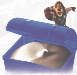
Schatztruhe Zum Entdecken und Staunen. Eine Überraschung mit Vanille und Chocolat Glace CHF 6.00