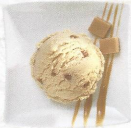
Caramel Rahmglace mit Caramelstückchen