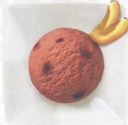
Zwetschgensorbet Sorbet mit Zwetschgenstückchen