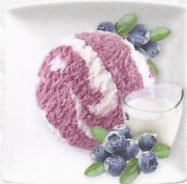
Blaubeer-Rahm Rahmglacé durchzogen mit feiner Blaubeersauce