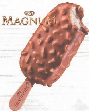
Magnum Almond Vanilleglace und Milchsokolade mit Mandeln CHF 3.50