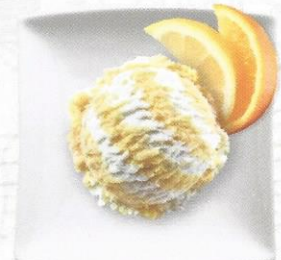
Eiercognac Rahmglace mit Mandel- Krokant